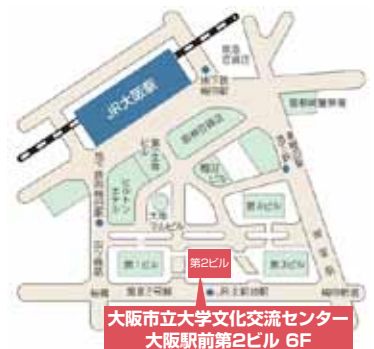
■JR「大阪」駅、Osaka Metro「梅田」各駅下車